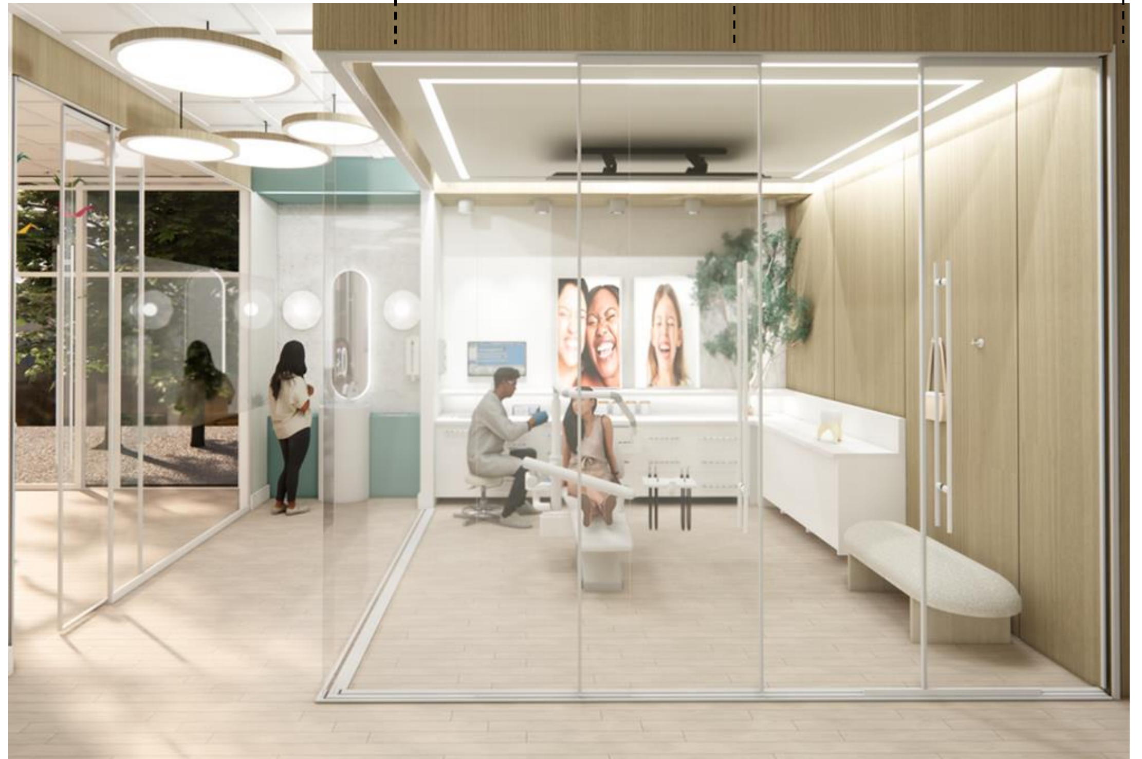
VUE SALLE DE PROPHYLAXIE