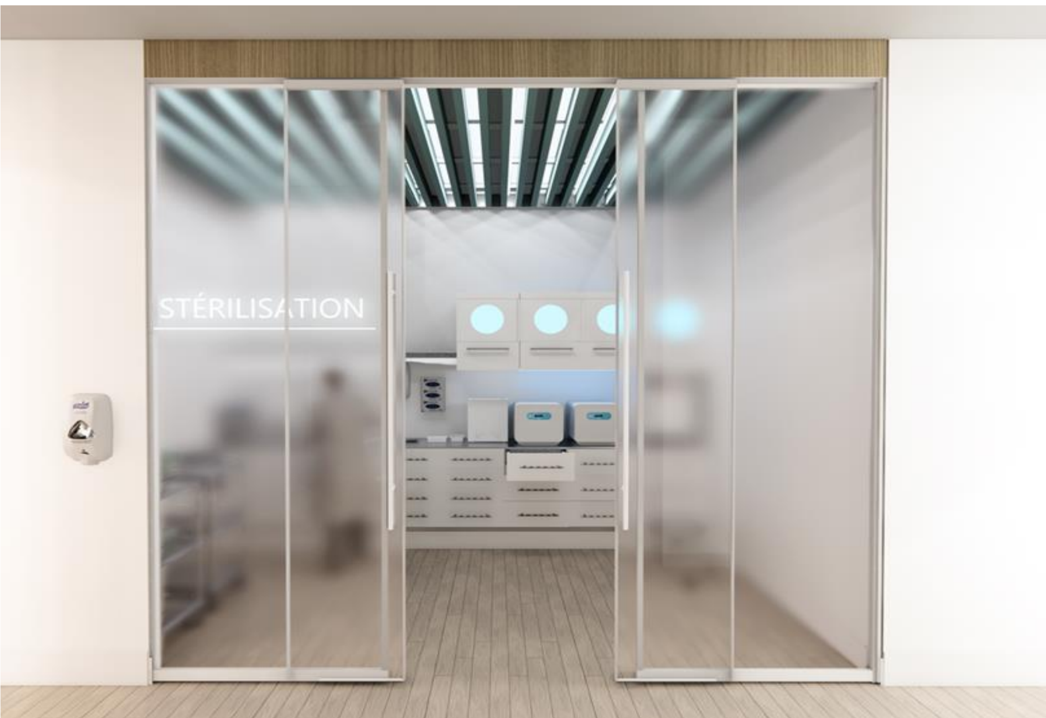
VUE SALLE DE STÉRILISATION