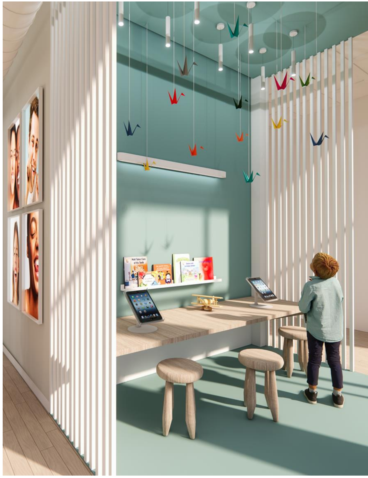
VUE ZONE ENFANT