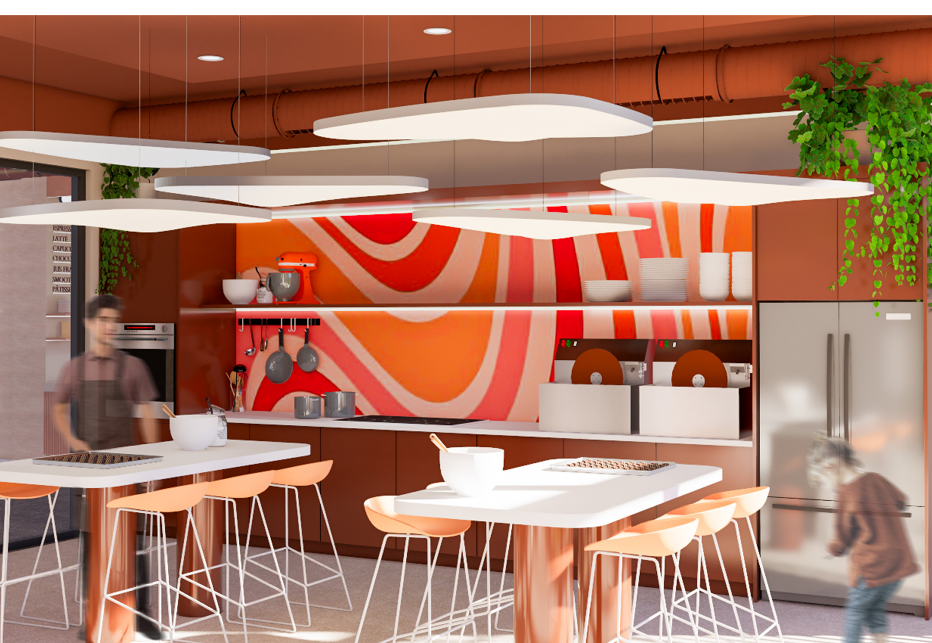
atelier de création