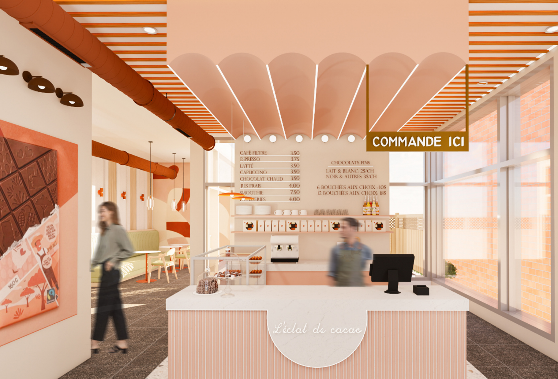
comptoir de réception