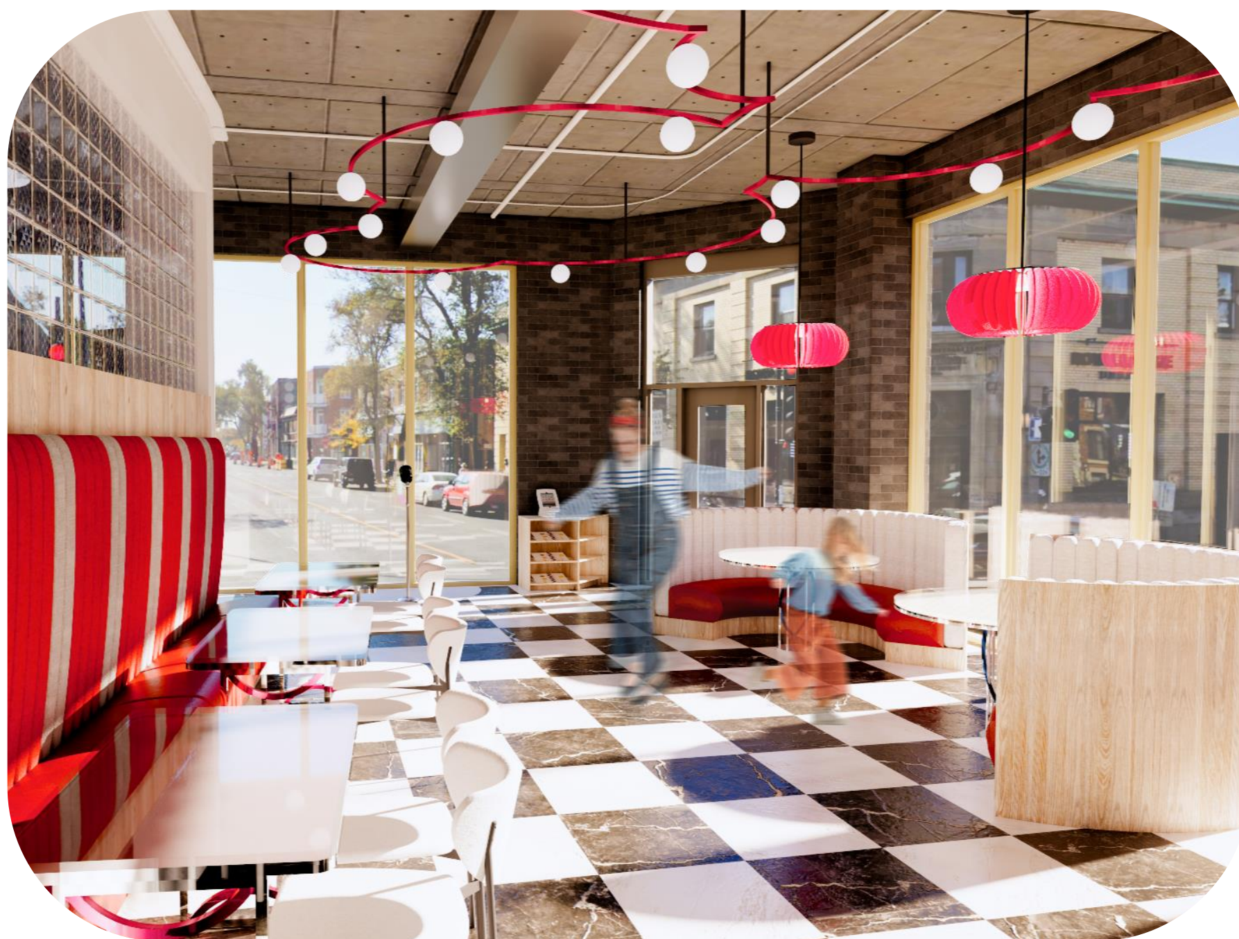
Salle à manger rock and roll