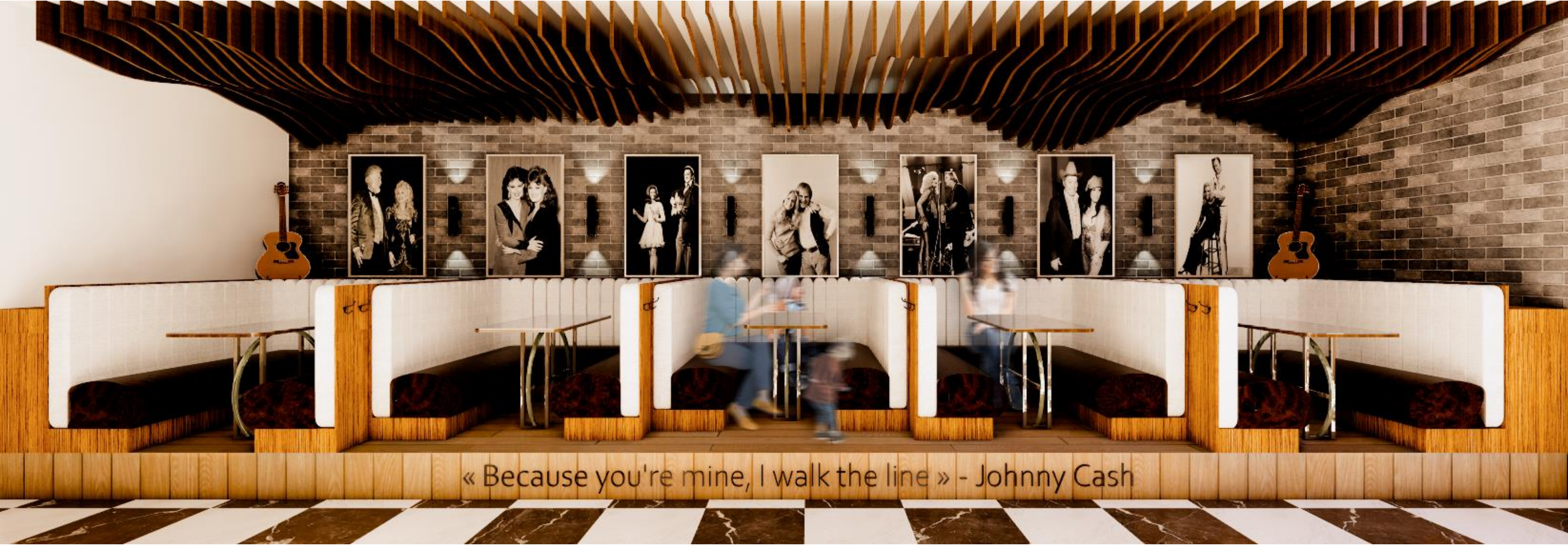
Salle à manger country podium