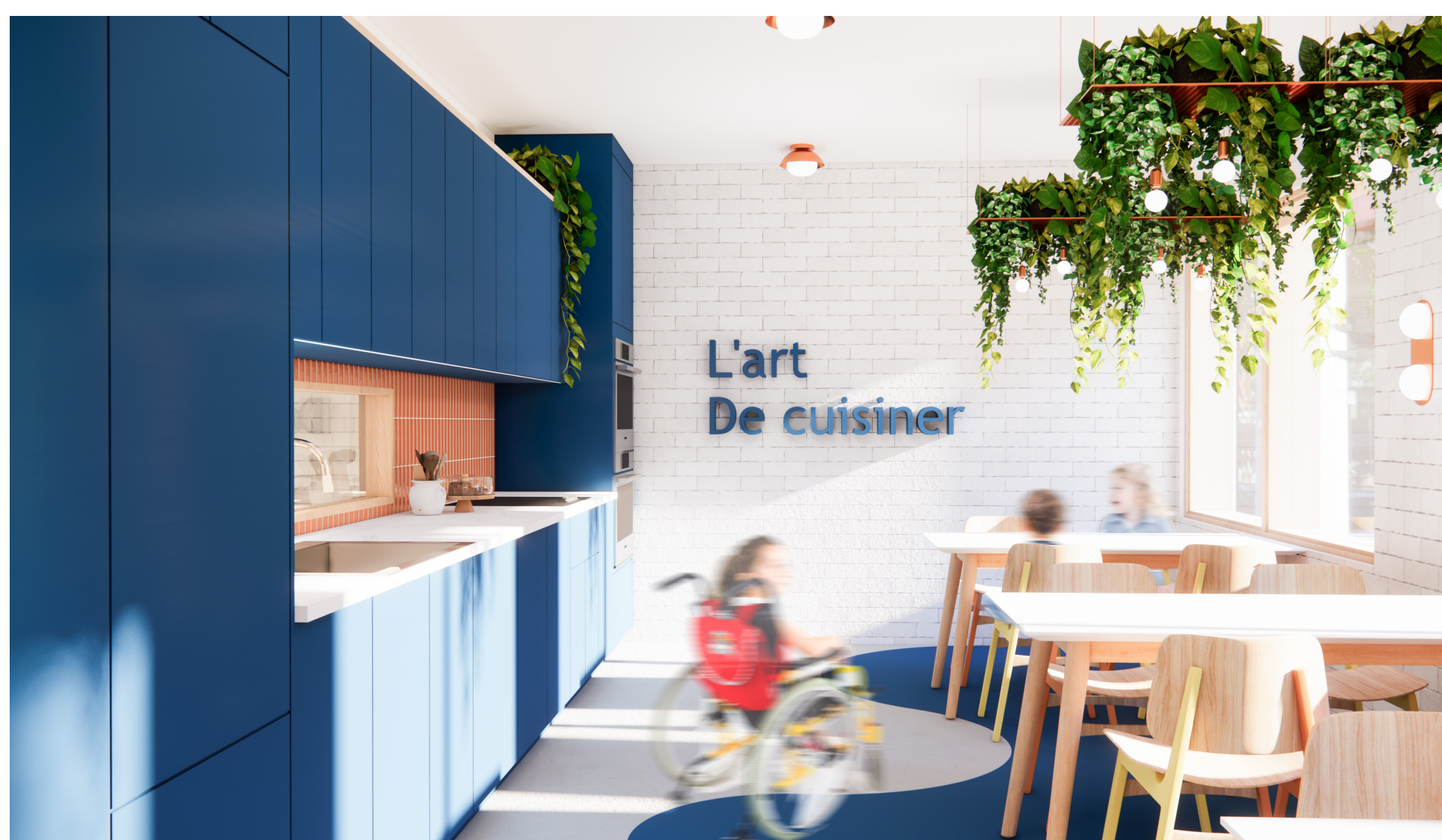
L'atelier de cuisine