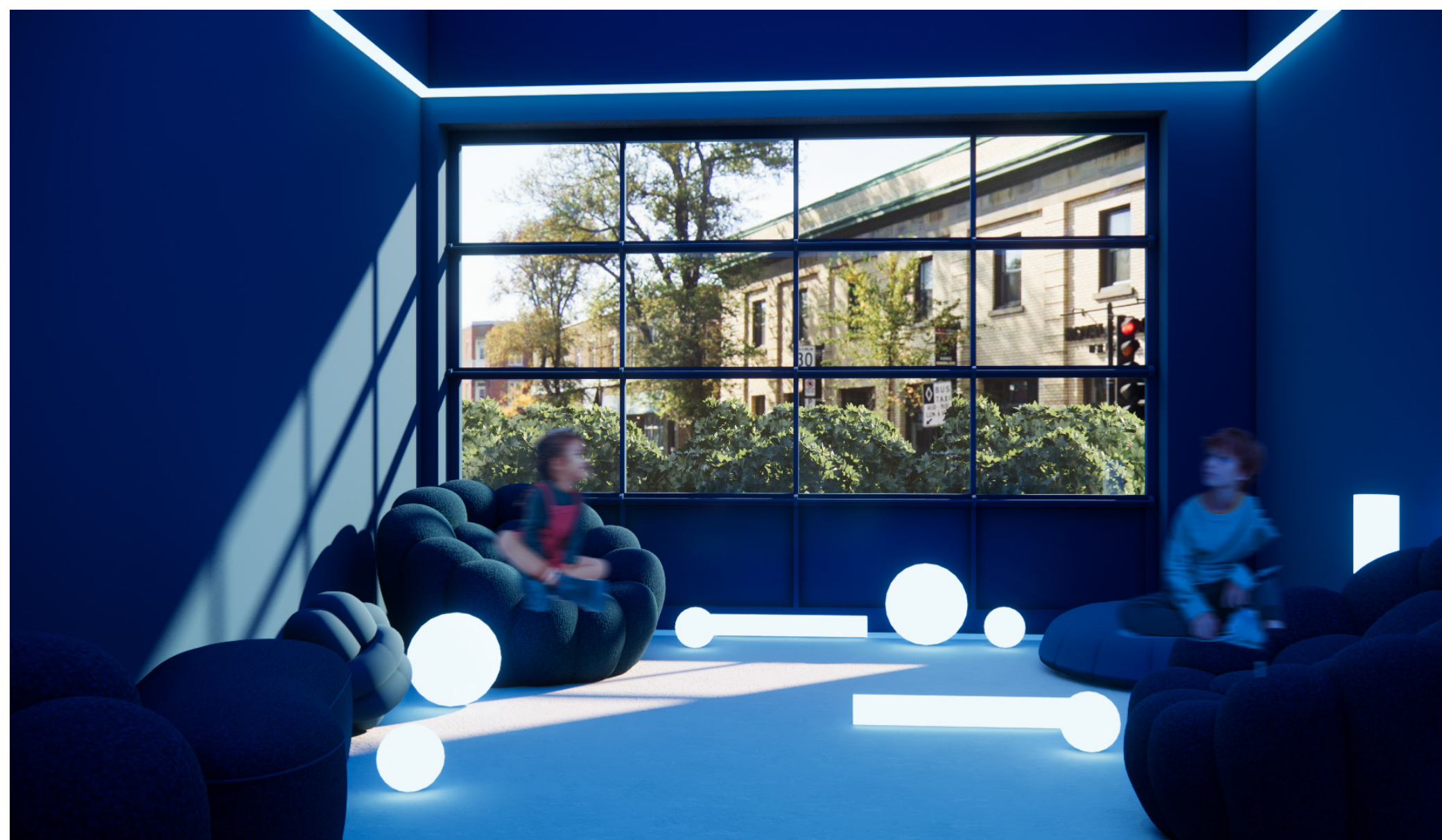
Salle de luminothérapie