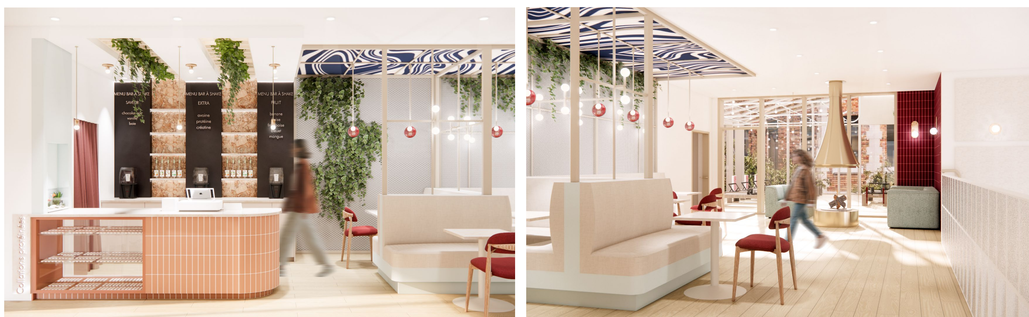
Comptoir bar et espace détente