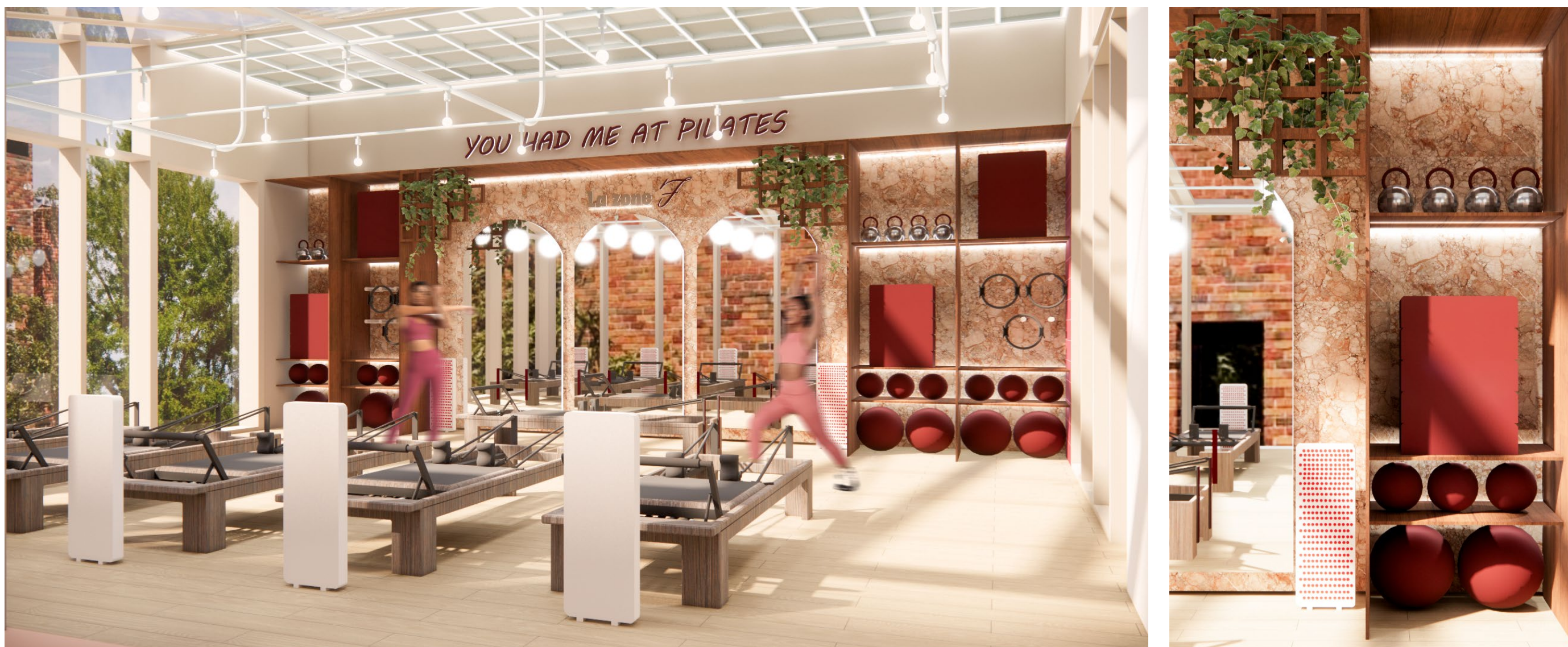
Salle de Pilates / Verrière