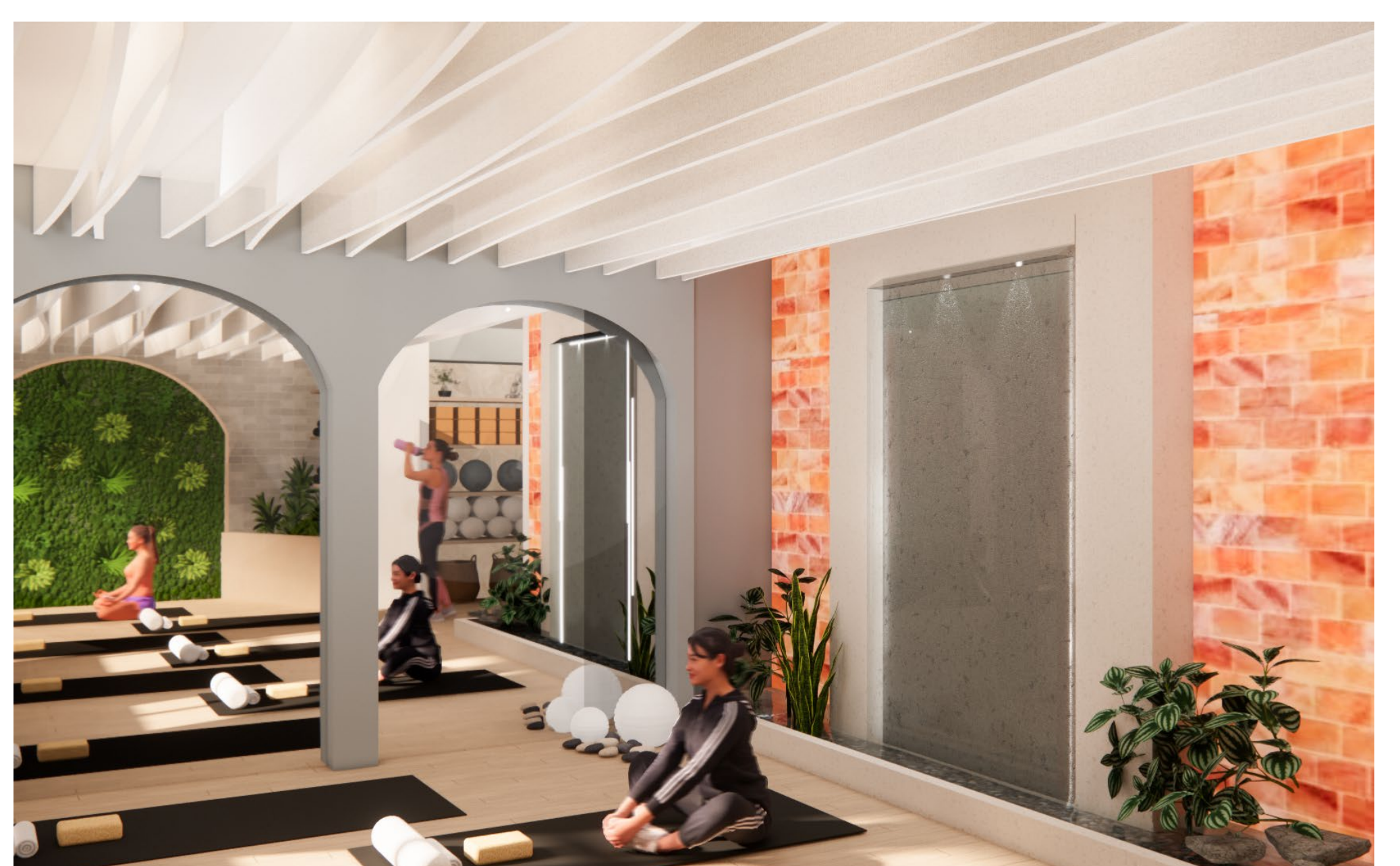
La Salle de Yoga