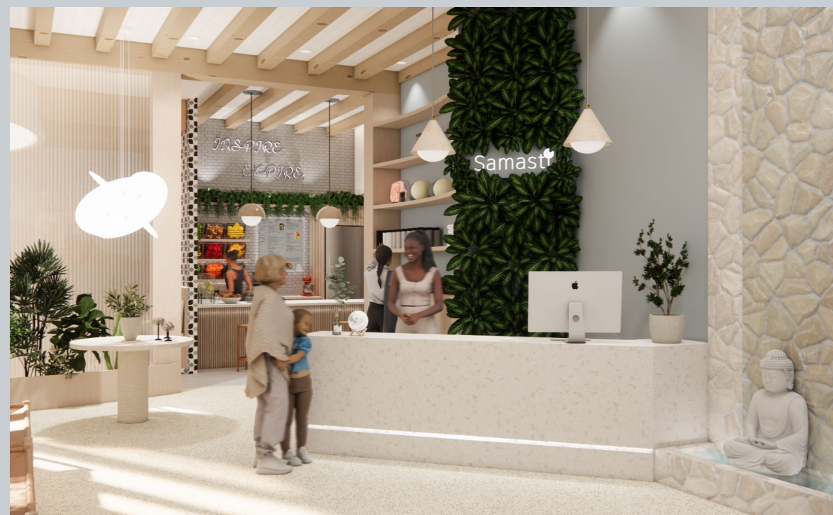
L'entrée du studio