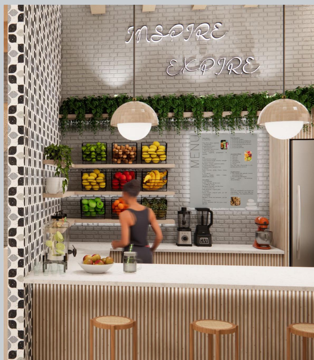
Le Bar à Jus