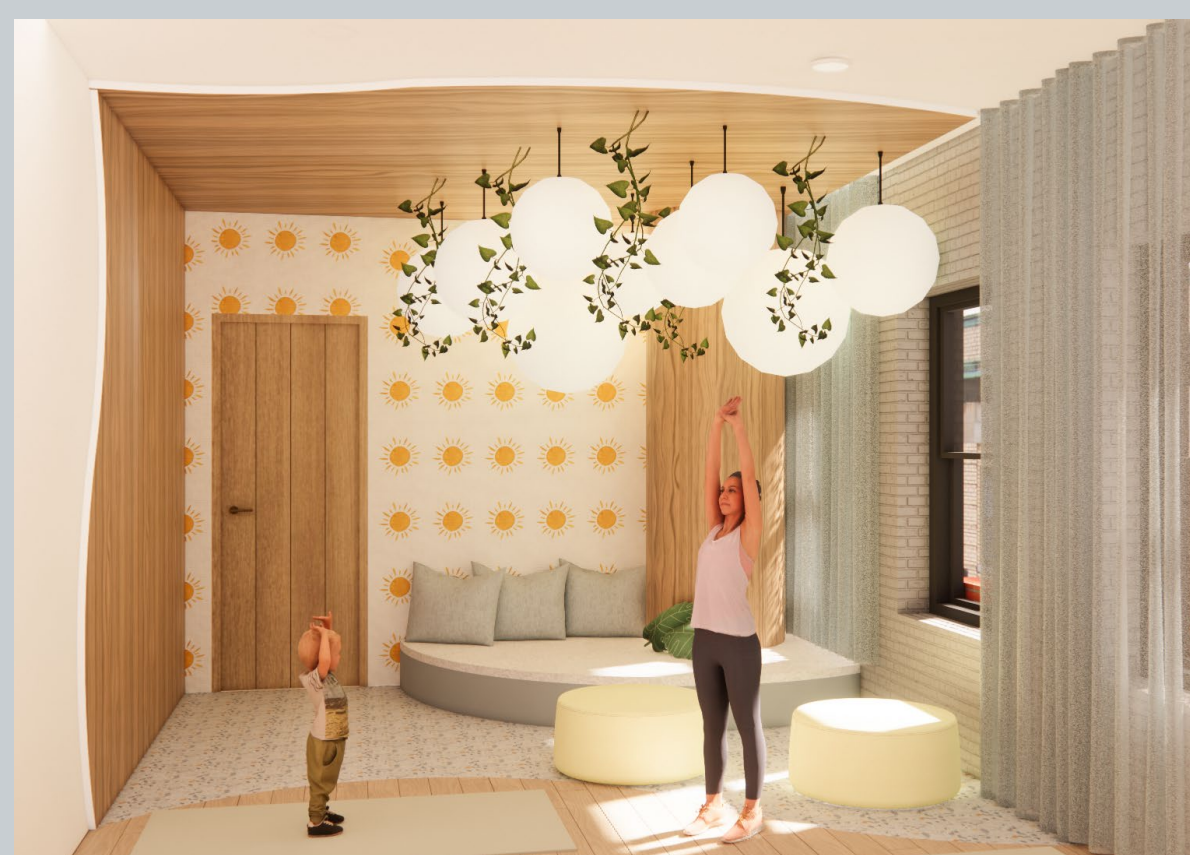
La Salle de Yoga pour Enfants